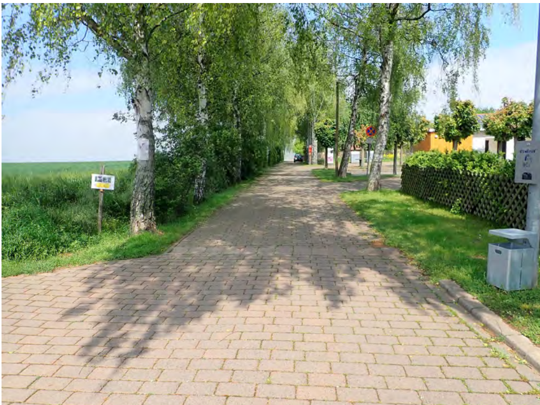
Bild 06: Die gepflasterte Straße unmittelbar östlich an das Plangebiet angrenzend