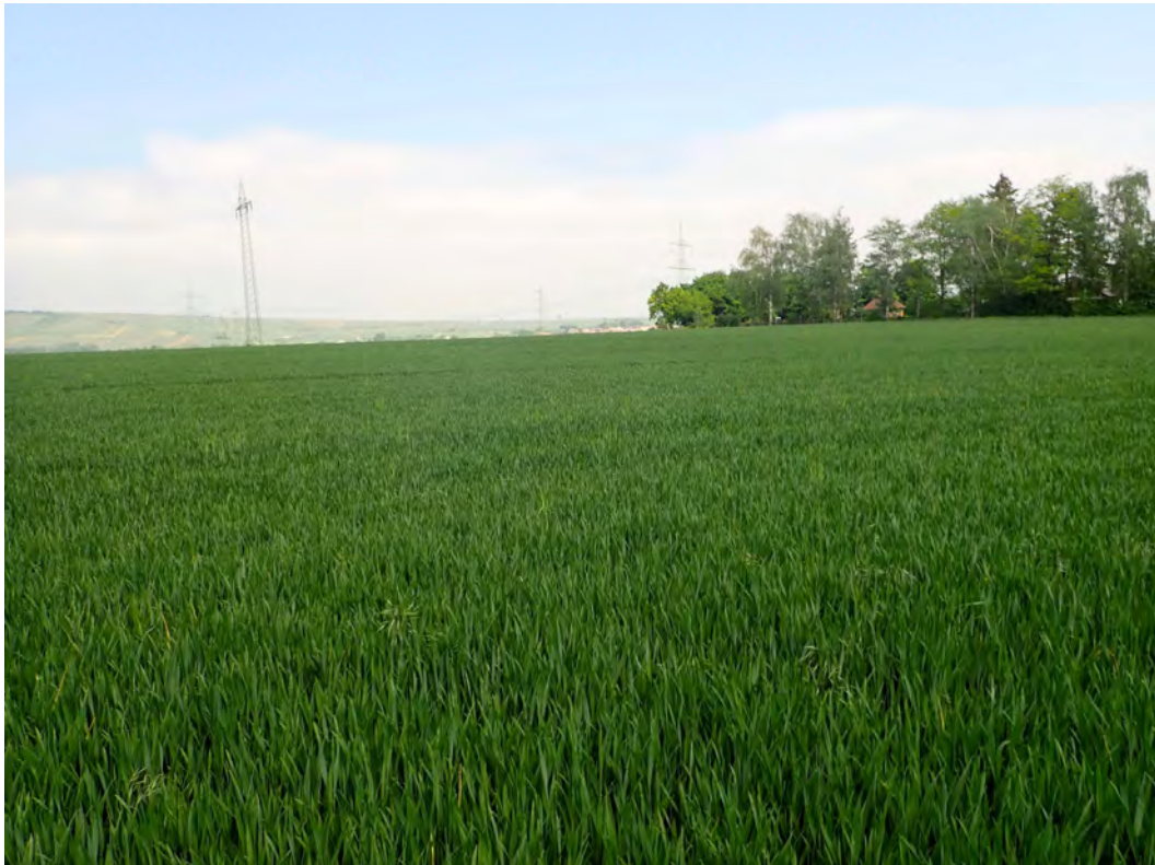
Bild 03: Der große Getreideacker mit Blick in nordöstlicher Richtung