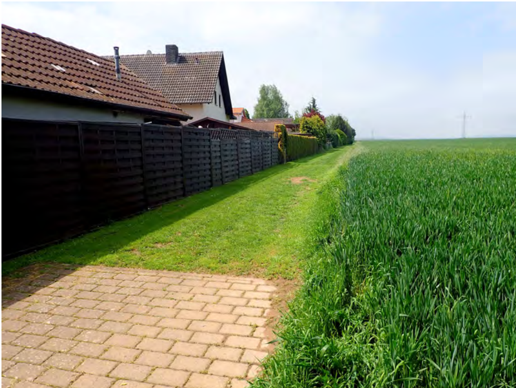
Bild 02: Die südliche Grenze des Plangebietes mit den angrenzenden Gärten