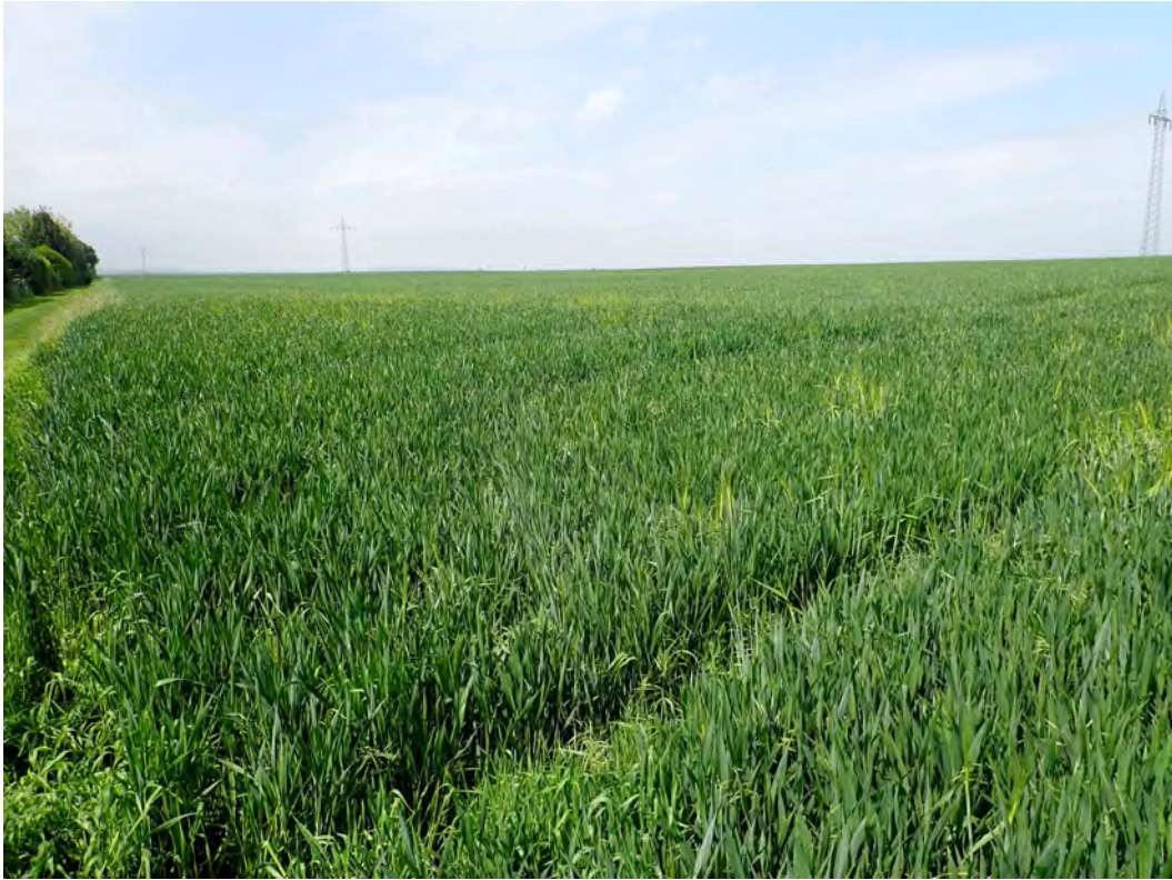
Bild 01: Blick von Südosten über das Plangebiet mit dem großen Getreideacker