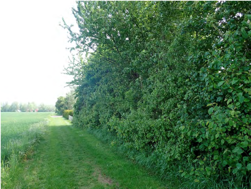
Bild 05: Gehölzstrukturen finden sich lediglich außerhalb des Plangebietes